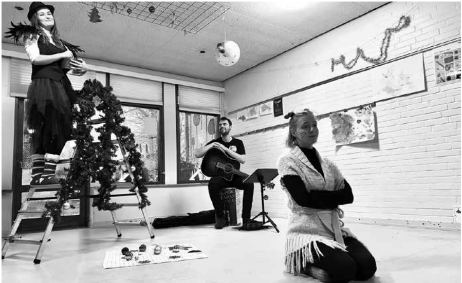
Weihnachtsspecial „Katze Bartputzer feiert Weihnachten“

Anfang November veranstaltete die AG Literatur des BDN Kulturausschusses eine Lesung mit der deutschen Erfolgsautorin Judith Hermann. Hermann las und sprach aus bzw. über ihren Roman „Daheim“ in der Deutschen Nachschule Tingleff. Der Ort war nicht zufällig gewählt – Hermanns