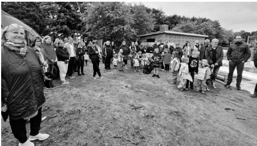
Richtfest KiGa Lügumkloster 2.6.22

Nach vielen Jahren Vorbereitung konnte der Wunsch der DKCT, einen neuen Kindergarten auf dem Gelände der Deutsche Schule Lügumkloster etablieren zu können, endlich erfüllt werden. Alle Arbeiten wurden bis Ende 2022 abgeschlossen. Gebäude und Spielplatz sind eine Bereicherung für unsere Arbeit vor Ort und wir haben mit der Etablierung der neuen Einrichtung einen Vorzeige-Kindergarten schaffen können.