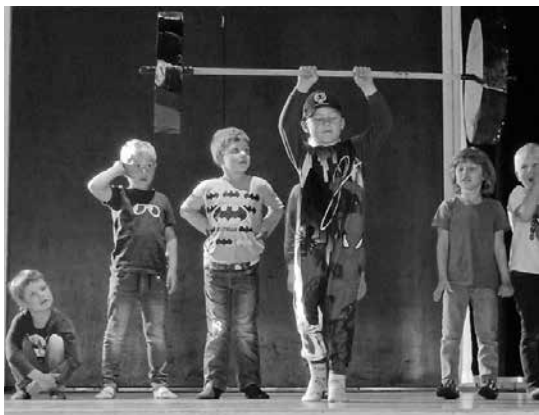
Starke Kinder der DKCT

Im Bereich der Deutschen Kindergärten Sonderburg (DKS) arbeiten wir weiterhin an einem Umzug des Gravensteiner Kindergartens in unser neues Gebäude in direkter Schulnachbarschaft. Das 380 m 2 große Gebäude liegt auf einem über 5000 m 2 großen Gelände, das reichlich Platz für Spiel- und Parkplatz bietet. Geplant ist zusätzlich ein Erweiterungsbauprojekt. Ein entsprechender Flächennutzungsplan wurde erarbeitet und