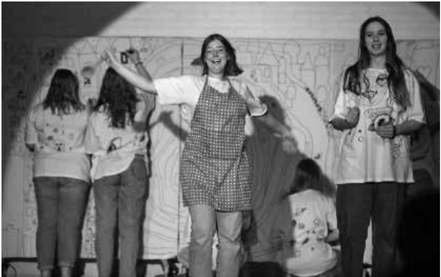
„Bilder einer großen Liebe“