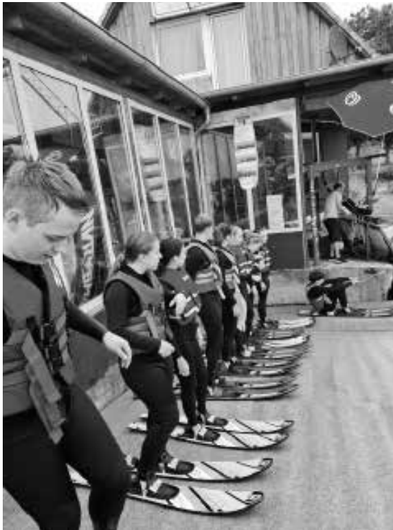
Die 2a auf Exkursion zum Wasserskiläufen