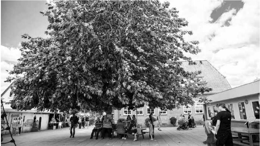
Hier lässt es sich aushalten: Ein schattiges Plätzchen an der Deutschen Schule Patt- burg Karin Riggelsen