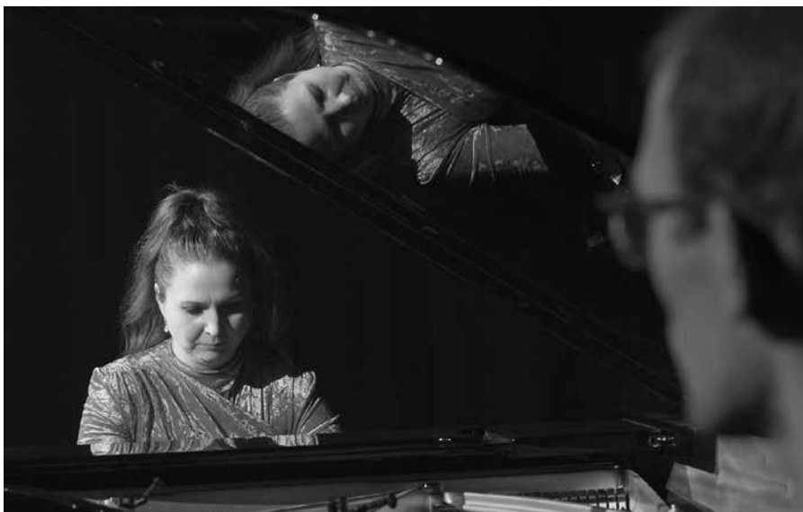
„PianoBattle“ im Oktober – musikalische Meisterleistung am Piano mit einem Hauch von Boxkampfatmosphäre