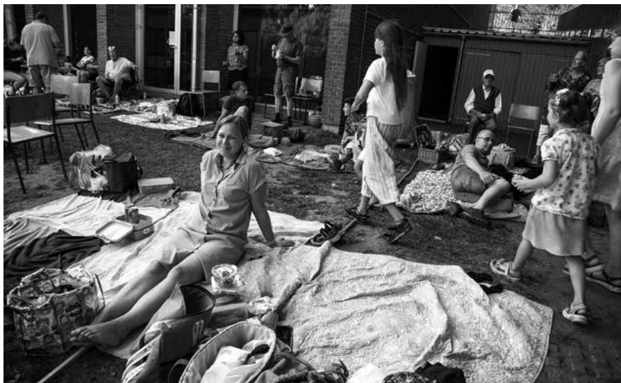
Volles Haus beim Sommerfest der Förde-Schule

Ganz sicher spielt auch die engagierte und fachliche Arbeit vor Ort, im überschaubaren Rahmen, eine sehr große Rolle. Die sehr gut belegten Kindergärten und -krippen haben im vergangenen Jahr rekordverdächtig viele Vorschüler und Vorschülerinnen in unsere eigenen Schulen geschmeidig übergehen lassen. Das zeugt von guter Arbeit überall in unserem System und von einem großen Vertrauen, das Kinder, Schüler und Schülerinnen und deren Eltern in uns haben. Dieses gilt es weiterhin mit einem qualitativ sehr guten Angebot zu befriedigen. Deshalb setzt der DSSV, trotz des großen Zuwachses, in erster Linie auf Qualität. Wir werden auch weiterhin