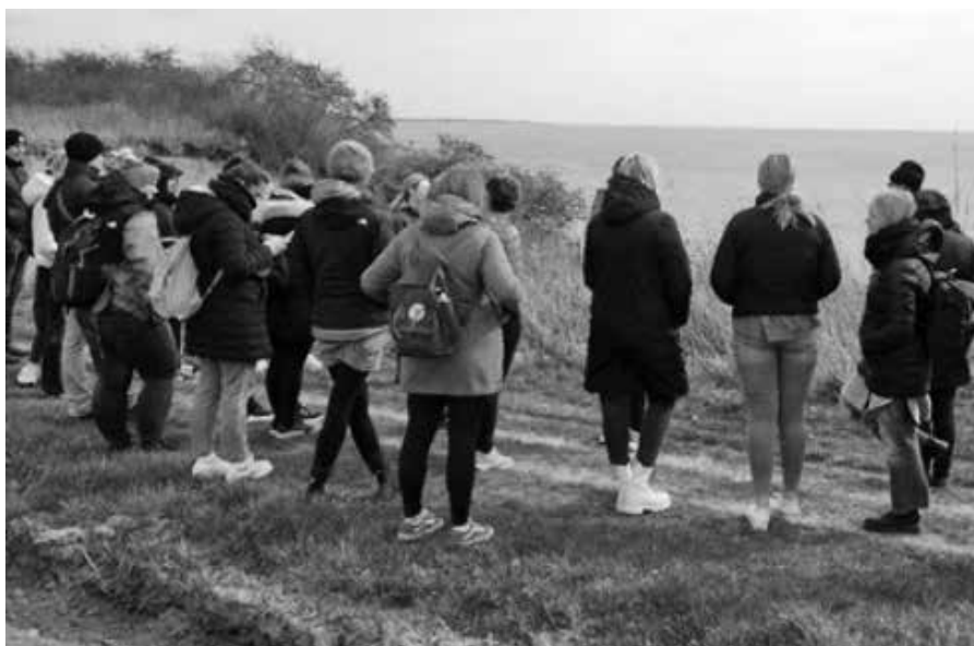
Wanderung am Gendarmenstieg in Verbindung mit dem Modul „Minderheitenpädagogik“

Am Ende des Seminars erarbeiteten die Teilnehmenden Projekte, Berichte und Filme, in denen sie ihre Reflexionen zum Seminar festhielten. Die Ko-