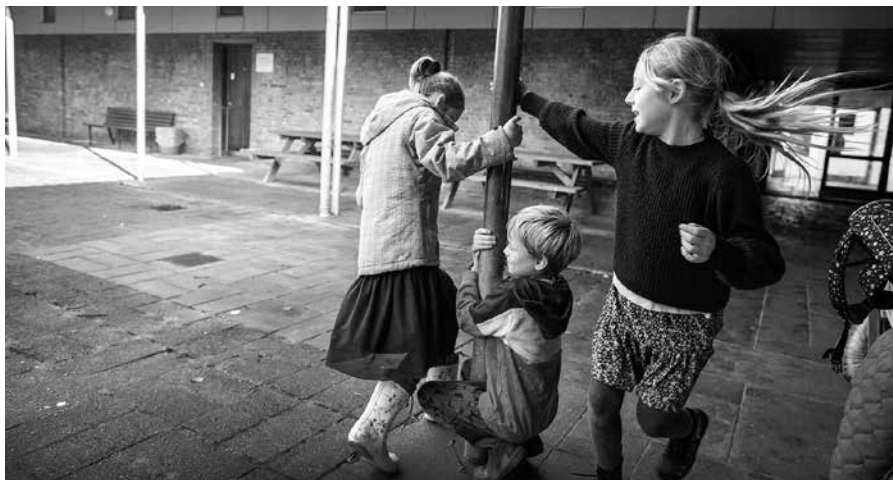
Spaß auf dem Pausenhof der Deutschen Schule Hadersleben

Stadt Flensburg und die Deutsche Kulturgesellschaft, Toosbüstr. 33, 24939 Flensburg