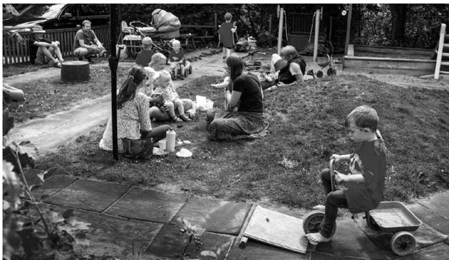
"Sommer-Hygge" im Deutschen Kindergarten Loit/Schauby

Als ein Ergebnis dieser Sitzung wurde der Wunsch nach übergeordneten Regeln für den Übergang von unseren Kindergärten in unsere Schulen vom Ausschuss und den Gesamtleitern und Gesamtleiterinnen als hoch