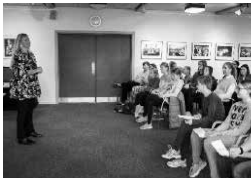
Gespanntes Publikum beim Vorlesewettbewerb