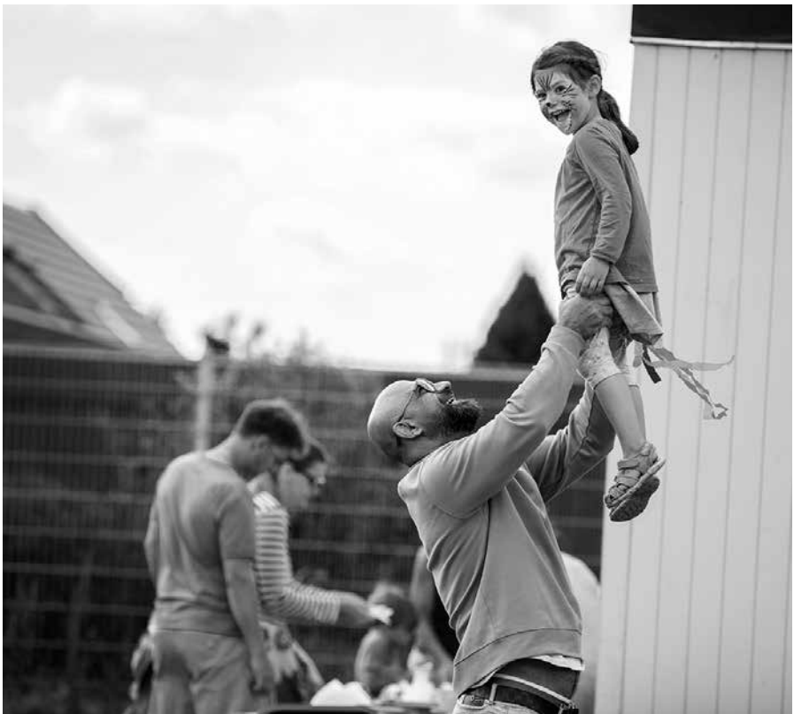
„Alles im Griff“ auf dem Miteinanderfest an der Deutschen Schule Pattburg

Leiterin des Schulpsychologischen Dienstes