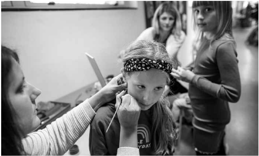
Groß schminkt Klein an der Deutschen Schule in Tingleff