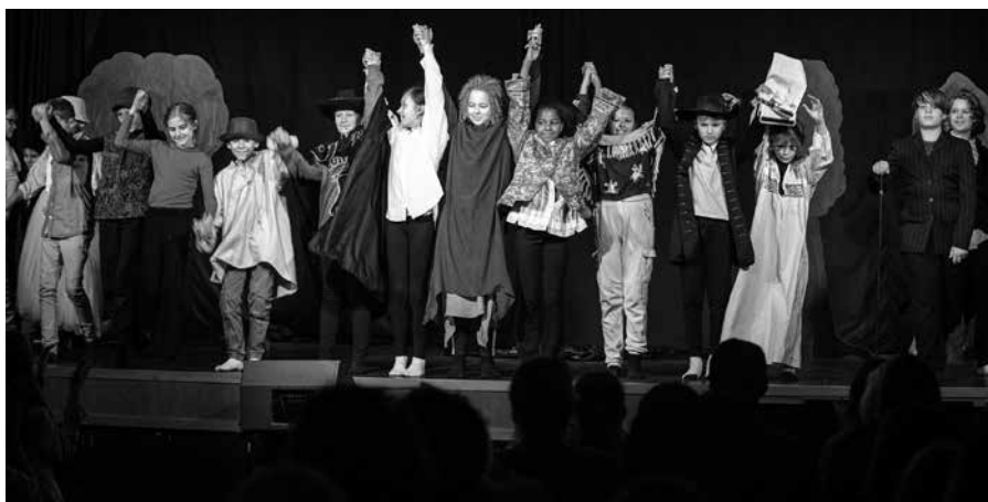
Gemeinschaft stärkt: stolze Schüler und Schülerinnen der Deutschen Schule Sonderburg nehmen ihren Applaus entgegen nach der Aufführung des Weihnachtstheaters „Jeppe på Bjerget“.

Der DSSV konnte sich im Jahr 2022 über einen massiven Anstieg der Schülerzahlen freuen, der hauptsächlich auf die Zuwanderung vieler Familien aus der gesamten Bundesrepublik zurückzuführen ist, aber auch durch junge Familien, die nach vollendeter Ausbildung in den südlichen Teil Dänemarks zurückkehren. Dass unsere Kindergärten, Schulen und unser Gymnasium diesen Zulauf verzeichnen können, ist einzig und allein der fantastischen pädagogischen und fachlich qualifizierten Arbeit unserer Mitarbeitenden in allen Bereichen unseres Bildungsangebotes zu verdanken. Wichtig hierbei ist auch die Wertegrundlage des DSSV, die in unseren