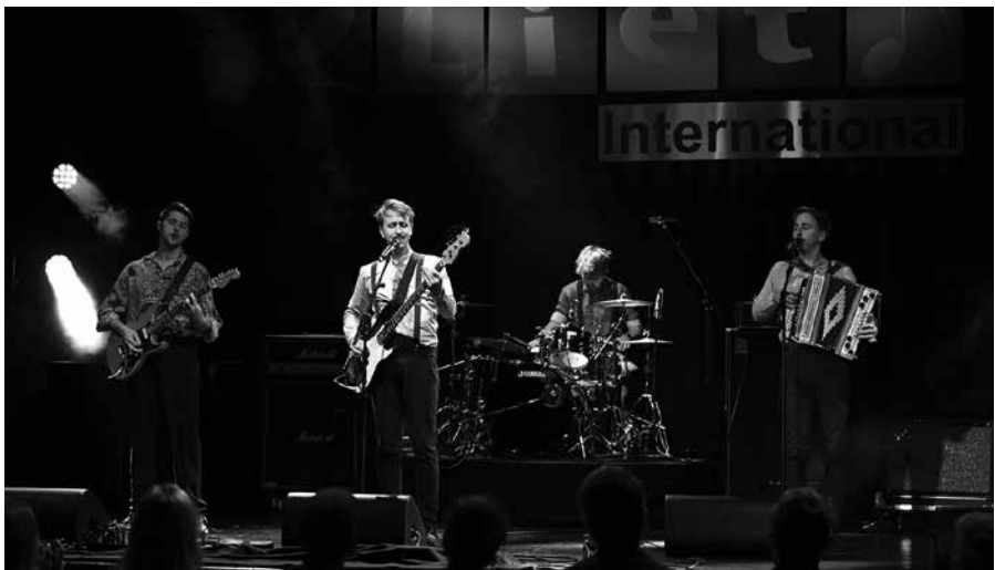
BDN Kulturhighlight „LIET International 2022“

Kulturkonsulent, Bund Deutscher Nordschleswiger