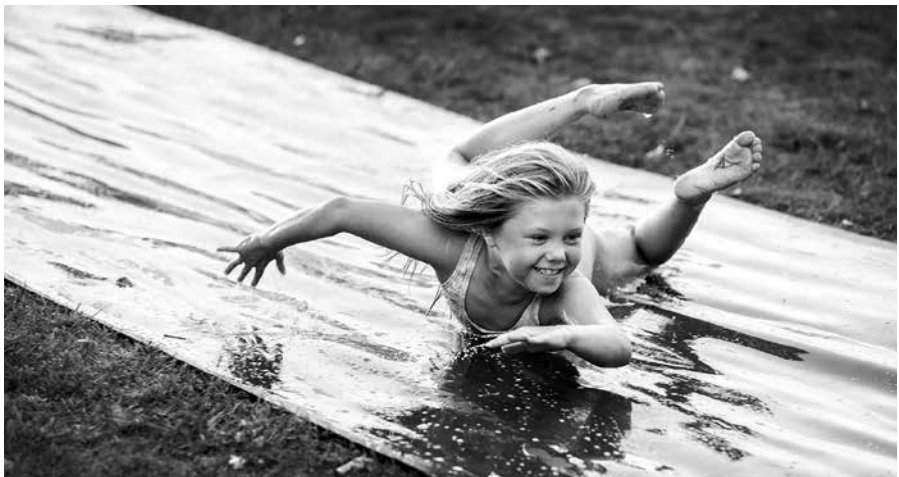
Wasserspaß auf dem Sommerfest an der Förde-Schule Gravenstein. Karin Riggelsen

Patenschaftsverbundung: SHHB Rendsburg/Eckernförde und Büdelsdorf