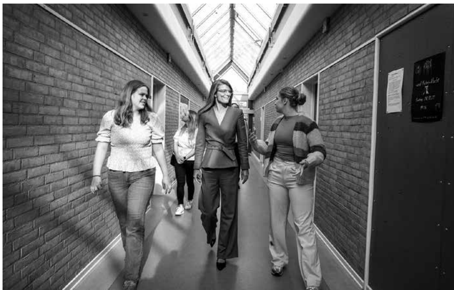
Staatsbesuch am DGN: Im September 2022 schaute die dänische Kulturministerin Ane Halsboe-Jørgensen, mittlerweile Ministerin für Beschäftigung, am DGN vorbei. Karin Riggelsen

Gemeinde Kronshagen, Kieler Str. 72, 24143 Kiel Gymnasium Kronshagen, Suchsdorfer Weg 35, 24119 Kronshagen Katharineum zu Lübeck