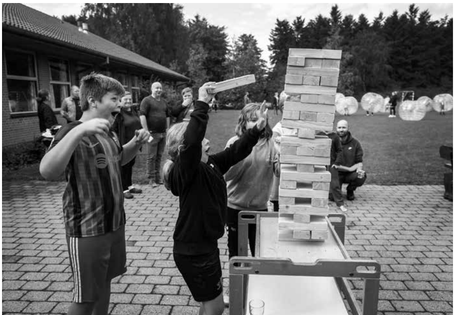
Familienspaß an der Deutschen Schule Buhrkall

An vielen Standorten sind wir an die Kapazitätsgrenze der Gebäude gekommen. Mit der Folge, dass wir sehr vielen, vor allem Zugezogenen, eine Absage erteilen mussten. Das tut sehr weh, ist jedoch unvermeidbar. Unsere Häuser sind nun einmal für kleine Lerngruppen und eine begrenzte Anzahl von Schülern und Schülerinnen und Kindern gebaut und lassen sich nicht einfach größer zoomen. An vielen Standorten haben wir durch Optimierung bessere Platzverhältnisse bekommen, an anderen Stellen haben wir gezwungenermaßen zwischenzeitlich Pavillons aufgestellt. Der Hauptvorstand hat sich schon seit geraumer Zeit mit Kapazitätsengpässen in unseren Einrichtungen beschäftigt. Aufgrund der etwas undurchsichtigen Lage, aber auch aufgrund sich stetig ändernder äußerer Signale, ist eine endgültige Priorisierung der Investitionsmaßnahmen erst jetzt möglich gewesen. In diesem Zusammenhang ist sehr erfreulich, dass der Kindergartenneubau in Lügumkloster abgeschlossen werden konnte und sich die Kinder jetzt in einem zeitgemäßen, neuen Kindergarten sehr wohl fühlen. Für den Standort in Gravenstein/Rinkenitz ist zurzeit die Planung für den nächsten Kindergartenbau in vollem Gange.